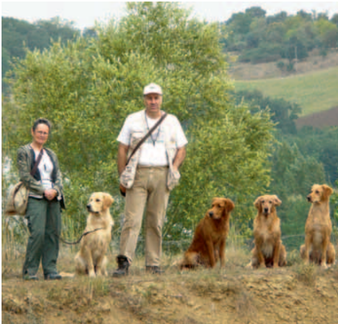
L'équipe de retrievers de Sabournac prête pour le ramassage.

Dès le début de la première battue, on est impressionné par la hauteur du vol des oiseaux. Ils passent la ligne non pas isolés mais par groupe de 5, 10 voire 20 ou plus encore. Cela rend le tir encore plus complexe car il est impératif de choisir un oiseau et de se concentrer sur sa trajectoire. Il va sans dire que même si la densité le permet, les "doublés" sont rarement réussis.